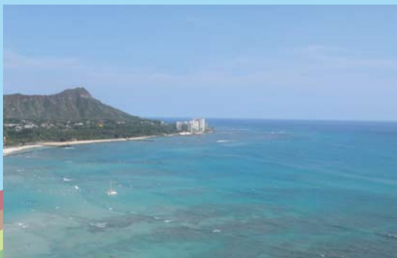
ワイキキビーチからダイヤモンドヘッドを望む